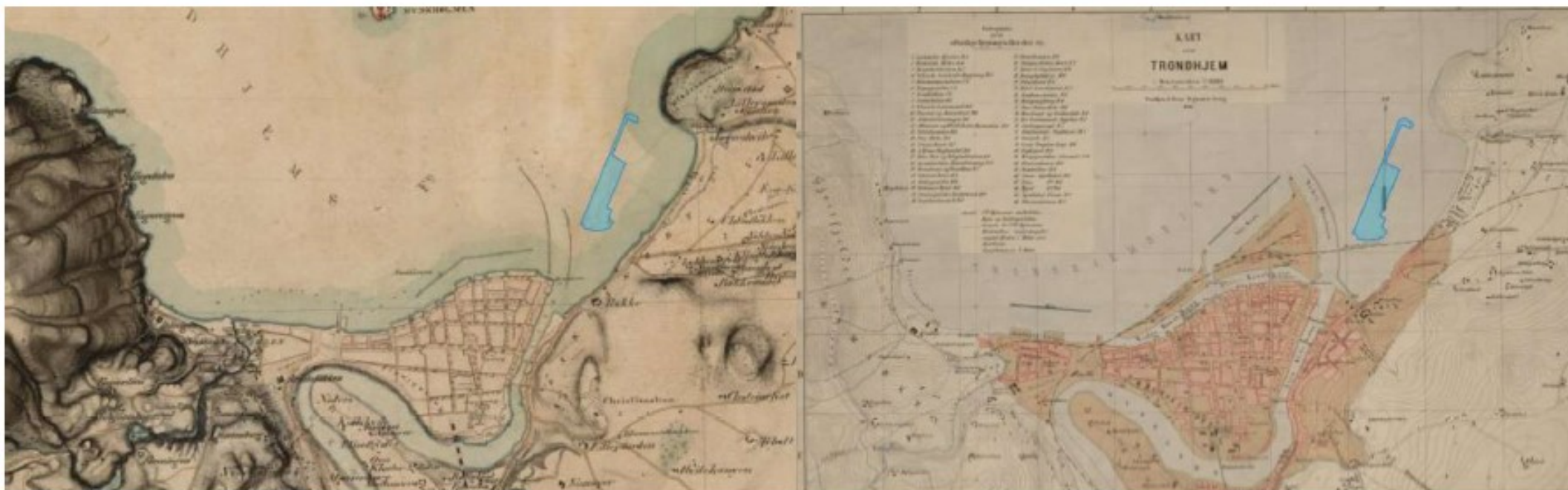
> Figur 5. Historiske kart fra hhv. 1867 (venstre) og 1885 (høyre). Planområdet inntegnet i blått. Historiske kart hentet fra kart.finn.no .